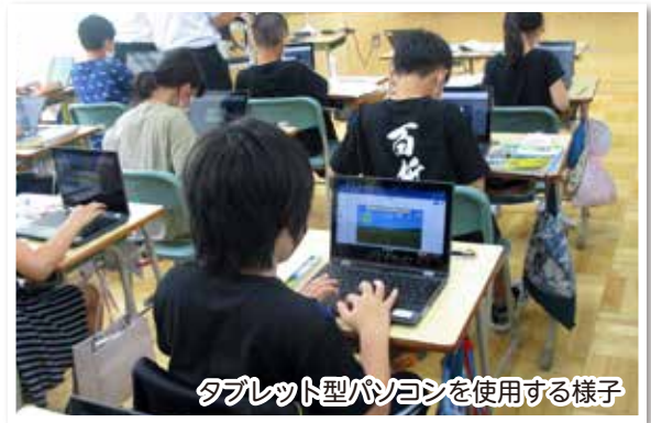
タブレット型パソコンを使用する様子