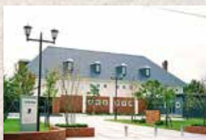
江別市郷土資料館