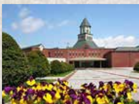
江別市セラミックアートセンター